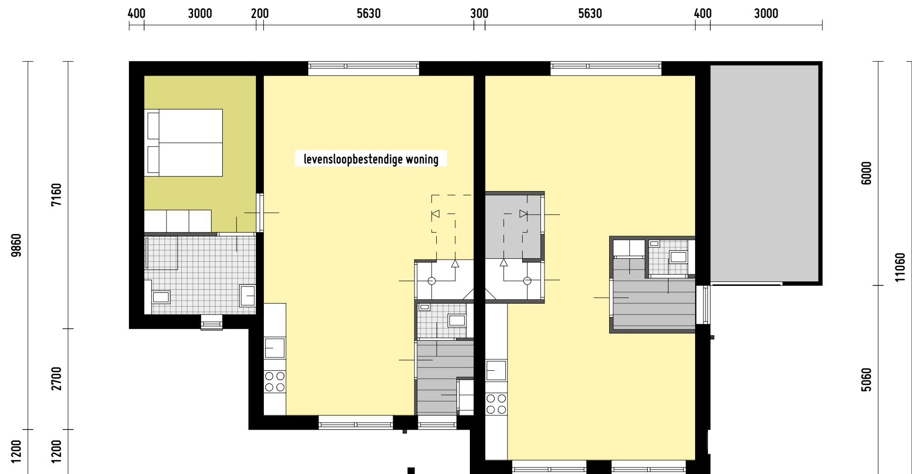
TYPE E1 125 m2 GBO